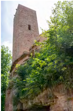
Hauptturm Scharfenberg Westseite

Zumindest ein Baudetail möchte ich in diesem Newsletters streifen: den Hauptturm . Das hohe schlanke Bauwerk ist das weithin sichtbare Wahrzeichen von Burg Scharfenberg. Er wird in der Burgliteratur meist als Bergfried angesprochen und diese Titulierung vererbte sich unkritisch von Publikation zu Publikation. Anders die jüngeren Analysen von Pohlit/ Reither/ Schlieger (2022), denn sie beziehen den Innenaufbau des Turms mit ein, und kommen zum Ergebnis, dass das kein wehrhafter Bergfried war. Er diente vielmehr als Gefängnis und/oder als Wartturm. Ich lade dazu ein, Näheres hierzu auf meiner Webseite nachzulesen.